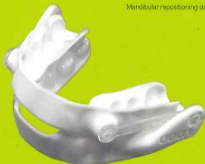
Narval CC™ Mandibular repositioning device